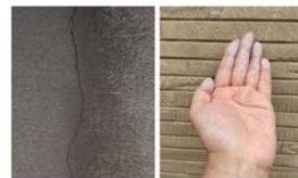
壁のひび割れ 手に白い粉がつく

人間の健康診断と同じで、早期発見、早期治療はとても大切です。放っておくと知らないうちに悪いところが進行し、完治するまでに、時間も費用も掛かります。これからも安心して暮らすため検査をしましょう。