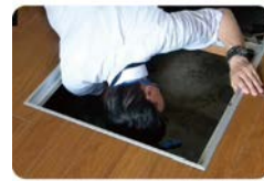
目の届きにくい場所もチェック