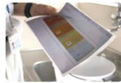
水回りの錆、作動状況をチェック。