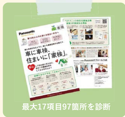
最大17項目97箇所を診断

一度、ちゃんと専門家に見てもらった方がいいかもしれない。 家も人間と同じで、年を重ねていくうちに あちこち傷んでくるのよね〜。元気に長生き するためにも、私もわが家も、ときどき 健康診断が必要ネ。具合の悪いところを 早めに見つけて、早めに治しておくことが大切。 放っておいて大ゴトになる前に。