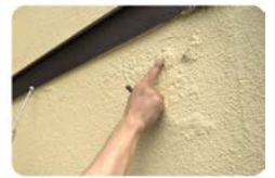
外壁の浮きやハガレをチェック。